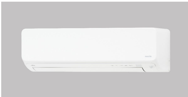
「ノクリア」DNシリーズ：高さ250mmのコンパクトな室内機

*「nocria」は株式会社富士通ゼネラルの世界的な商標です。「ノクリア」「あったかアップ」は株式会社富士通ゼネラルの登録商標です。