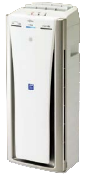
家庭用脱臭機 DAS-301R オープン価格*

さまざまなニオイ成分が混じり合って、日常的に発生し続けているのがお部屋の中のニオイ。 一般的な空気清浄機の脱臭能力では、そのすべてを取り除けないことも…。 脱臭機なら、脱臭・除菌・消臭で空気を丸ごと洗浄します。 ニオイの悩み、脱臭機でスッキリ解決しませんか？